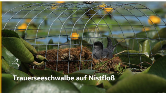
Trauerseeschwalbe auf Nistfloß

Jungvögel tragen ein deutlich helleres Gefieder als die Altvögel. Ihr Flug wirkt im Vergleich mit dem der Altvögel anfangs noch etwas unbeholfen.